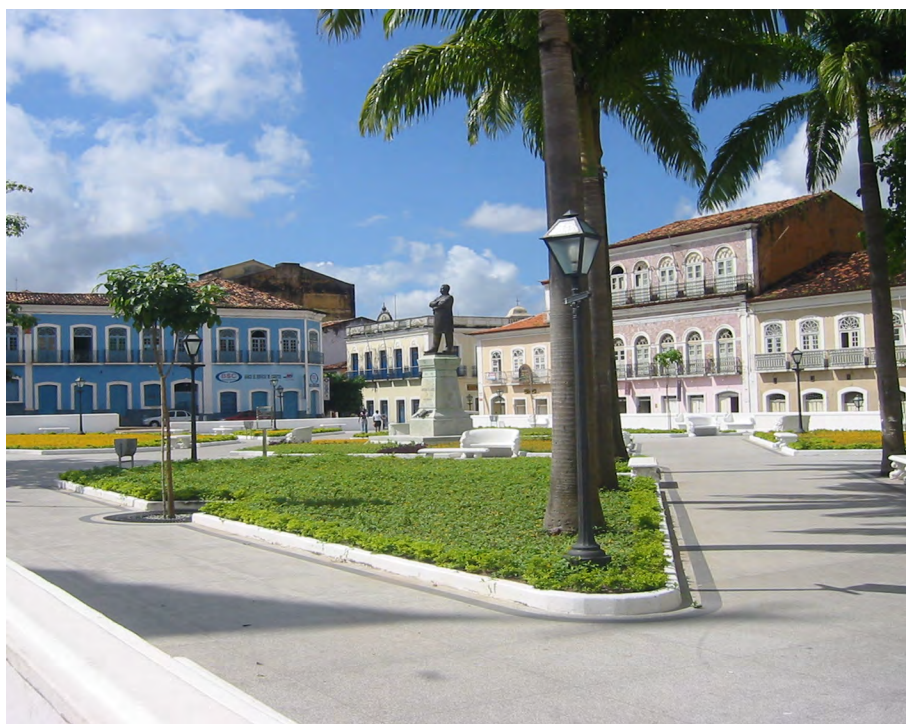
Sao Luiz de Maranhao

Fundada por los franceses en el año 1612, su nombre se debe al rey Luis XIII. Los franceses solo estuvieron ocho brillantes años sin esclavitud y con un desarrollo intelectual y artístico notable. Después llegaron los holandeses y la ciudad siguió su camino ascendente transformándose en una de las más importantes del s. XIX. Se la llamó la "Atenas Brasileña". A pesar de los siglos, el centro colonial ha permanecido intacto con sus tesoros arquitectónicos por ello fue declarada Patrimonio de la Humanidad por la UNESCO.